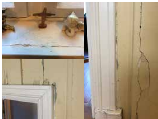
(Bilde over viser 3 eksempler på skader i nåværende bygg i Akersbakken 30.)