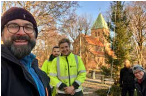
(Fra oppsetting av juletre: Sokneprest, representanter for bydelen/Braathen, trosopplærere og pilgrimsprest.)

Ikke bare har staben laget julekrybbe i kirkesenteret i Akersbakken 30. Ideen med å sette opp et stort juletre i den lille parken mellom kirkesenteret og Gamle Aker kirke har også kommet opp. Bydelen var umiddelbart begeistret for ideen, og mens bydelen skaffet både fundament og lys til treet, sørget menigheten for tre og stjerne.